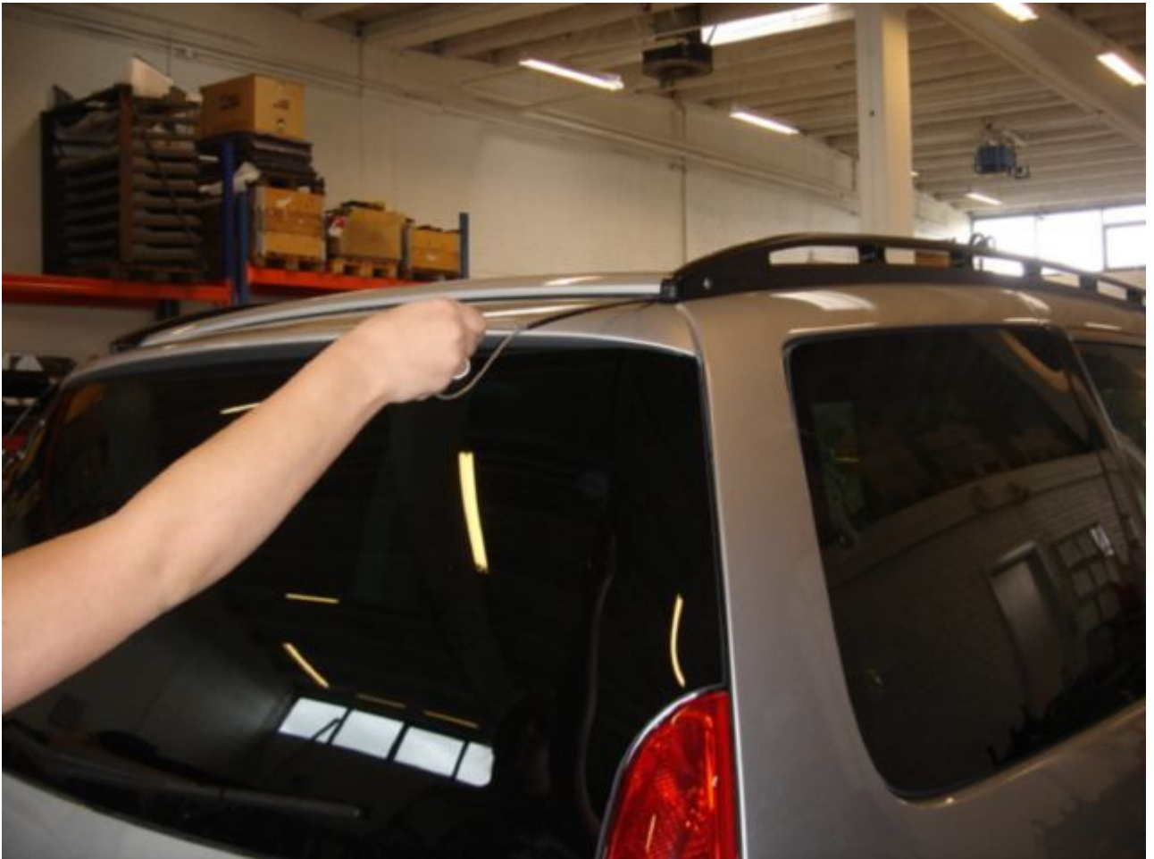
1. Tag udløserstropen ud fra bagklappen og træk i den.