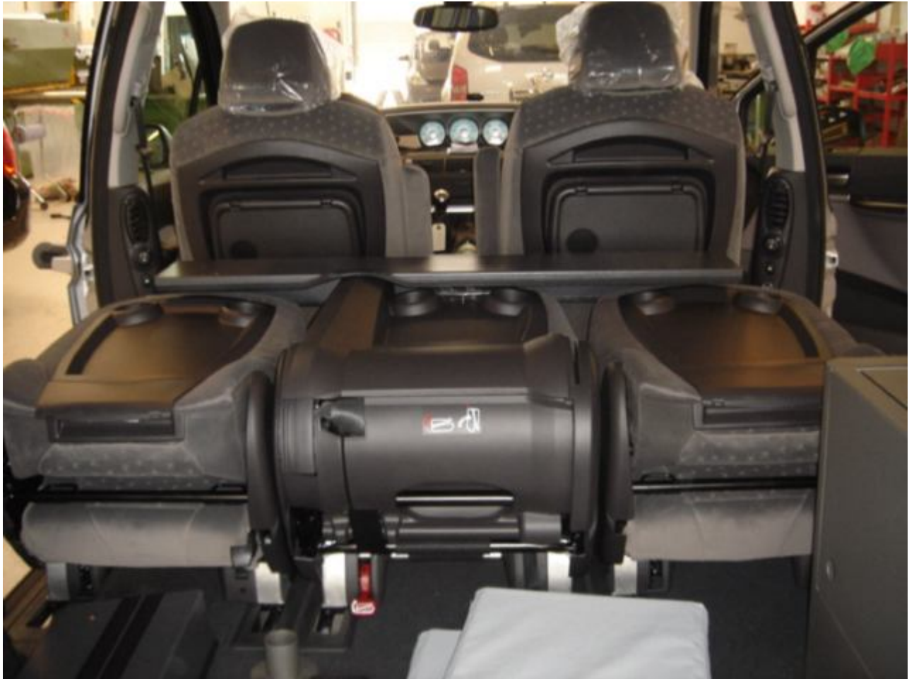
9. De tre midterste sæder er lagt ned. Set bagfra.