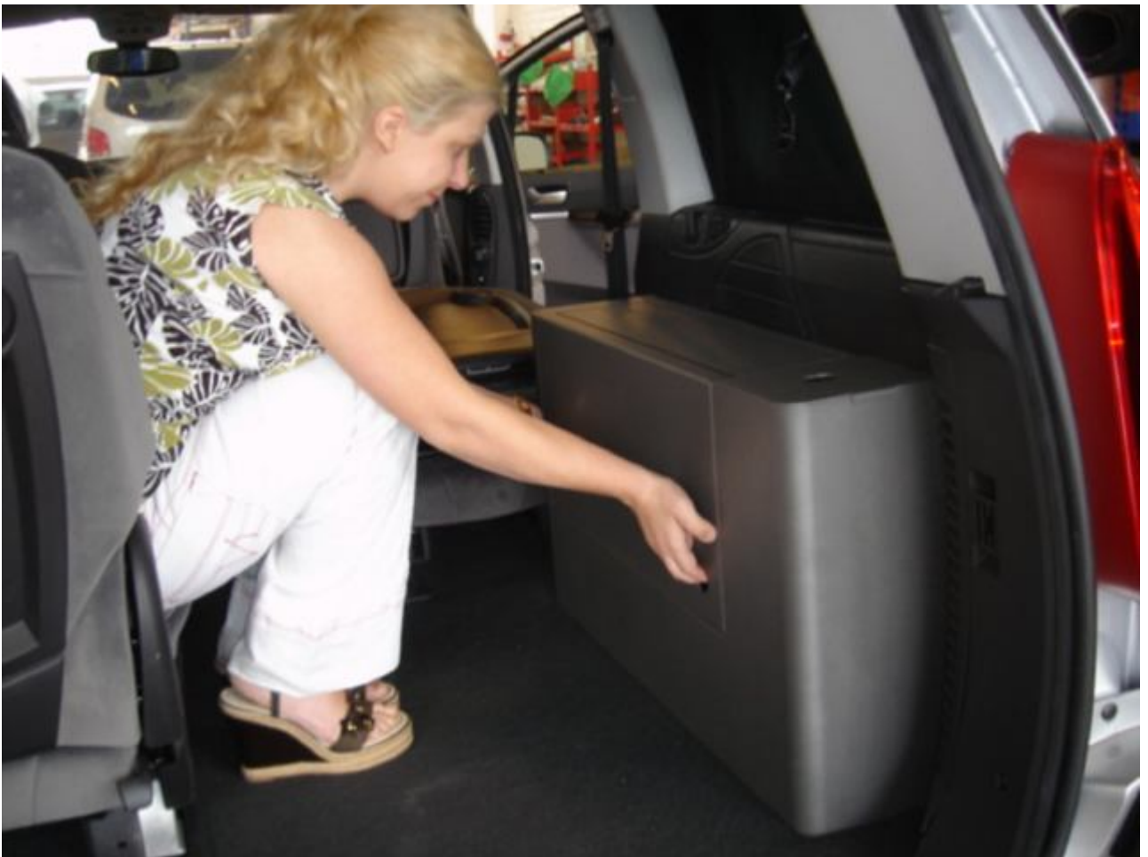
13. Betjening af køkkenet: Hiv op i begge huller i frontpladen.(Frontpladen er også bordpladen).