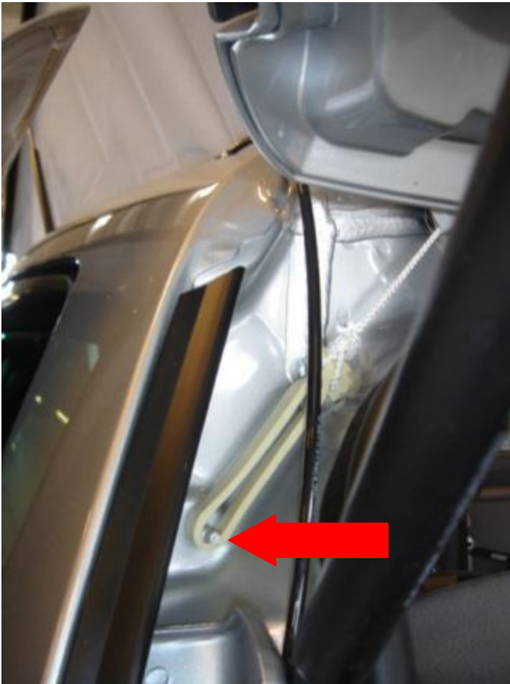
7. Anbring gummistroppen fra teltdugen på tappen.