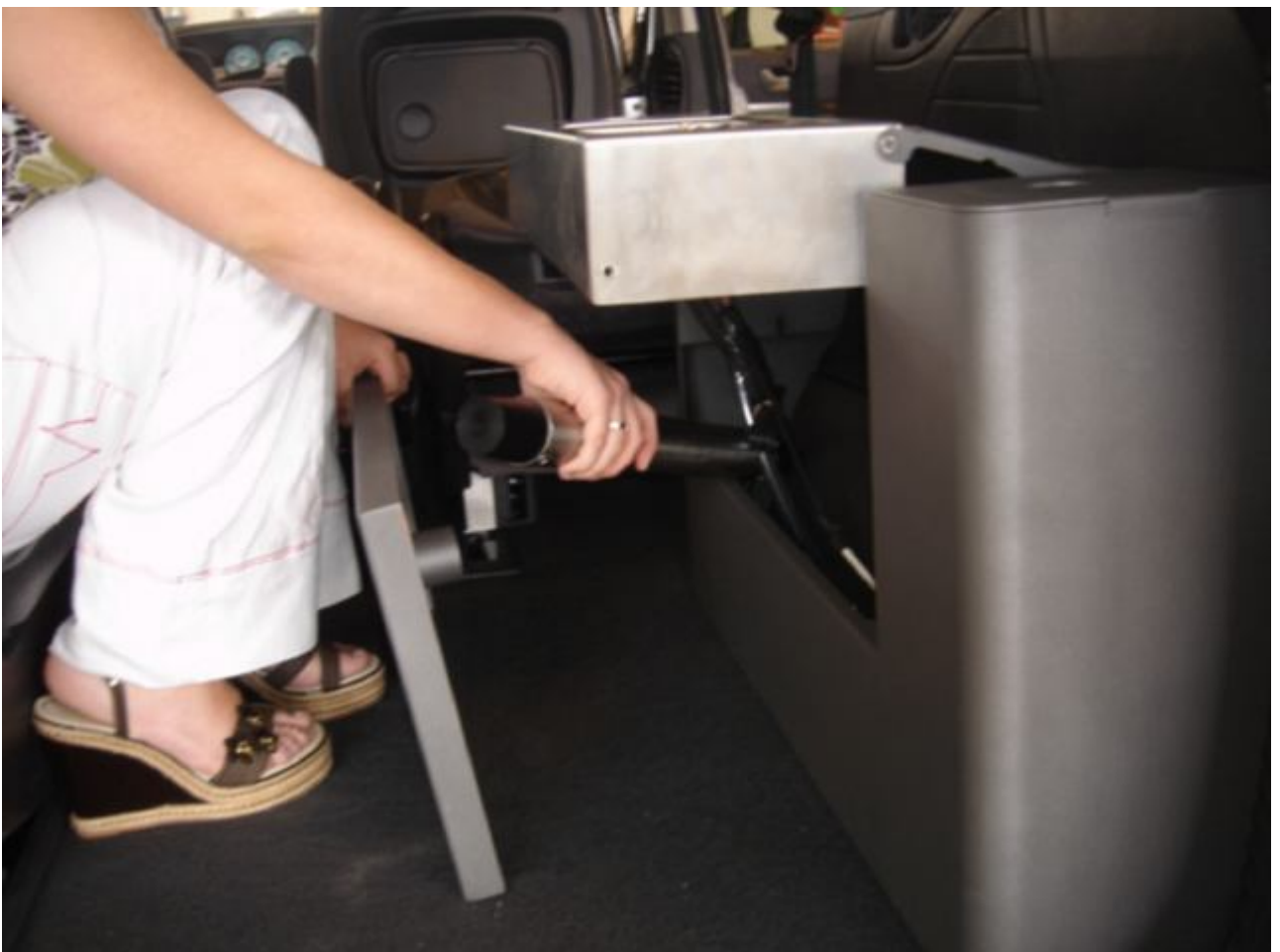
16. I bunden af køkkenet ligger stangen til bordet.