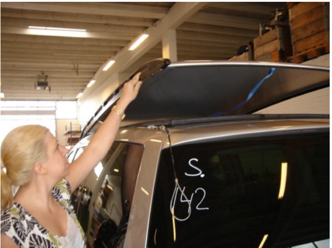
2. Skub taget op fra begge sider.