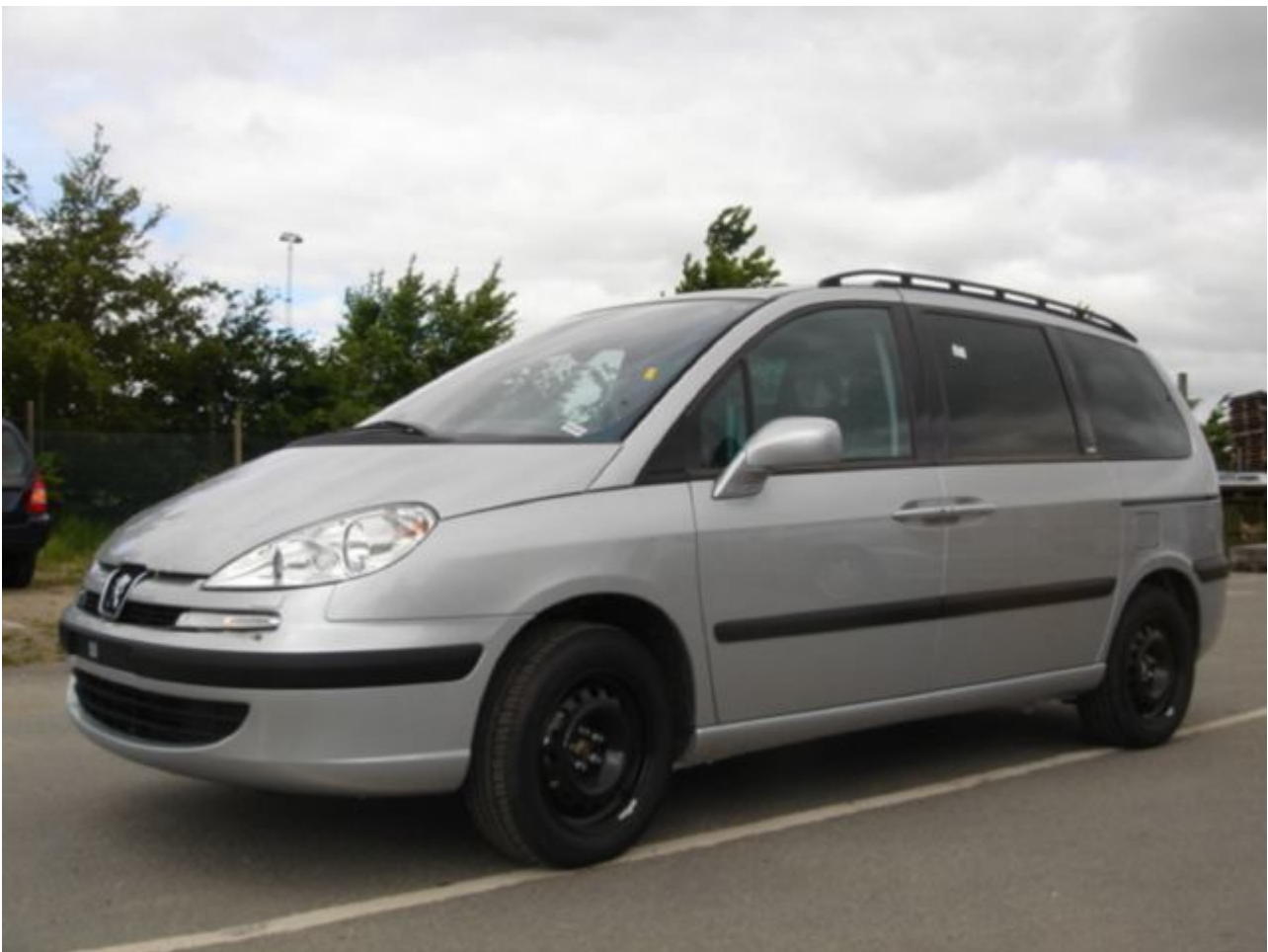
Peugeot 807 Camper