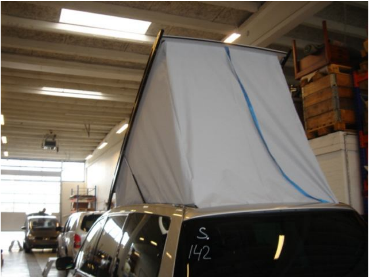
5. Teltdugen trækkes på hele vejen rundt og fastgøres på velcrobåndet på taget.