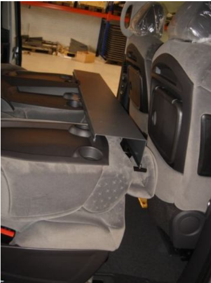
8. Montering af sovebeslag. Læg de tre midterste sæder ned. Træk nakkestøtterne en smule ud. Anbring det profil som har en udskæring i den ene kant vandret over sæderne/nakkestøtterne.