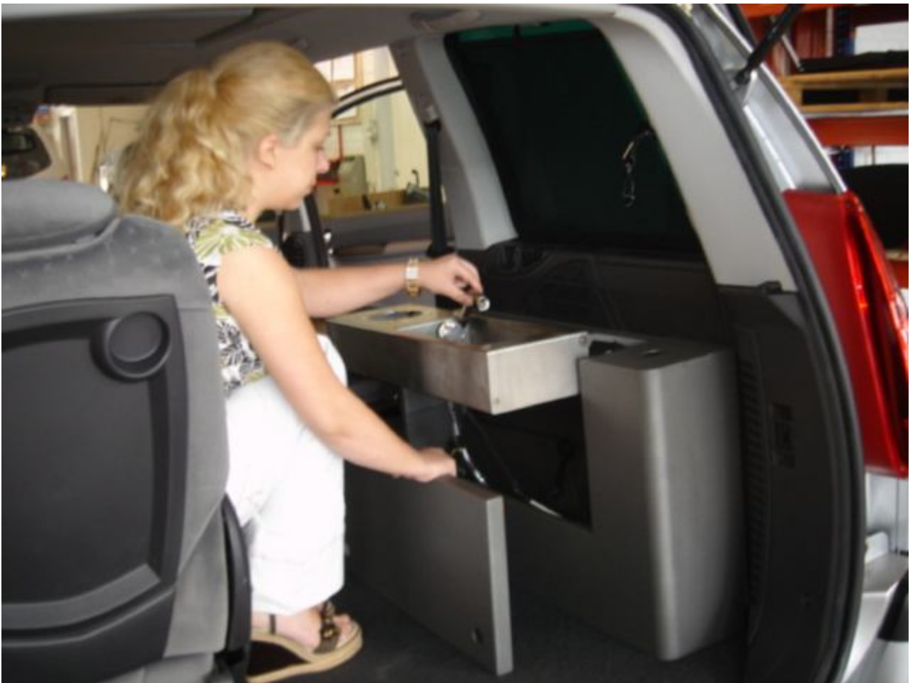
15. Justér vandhane.