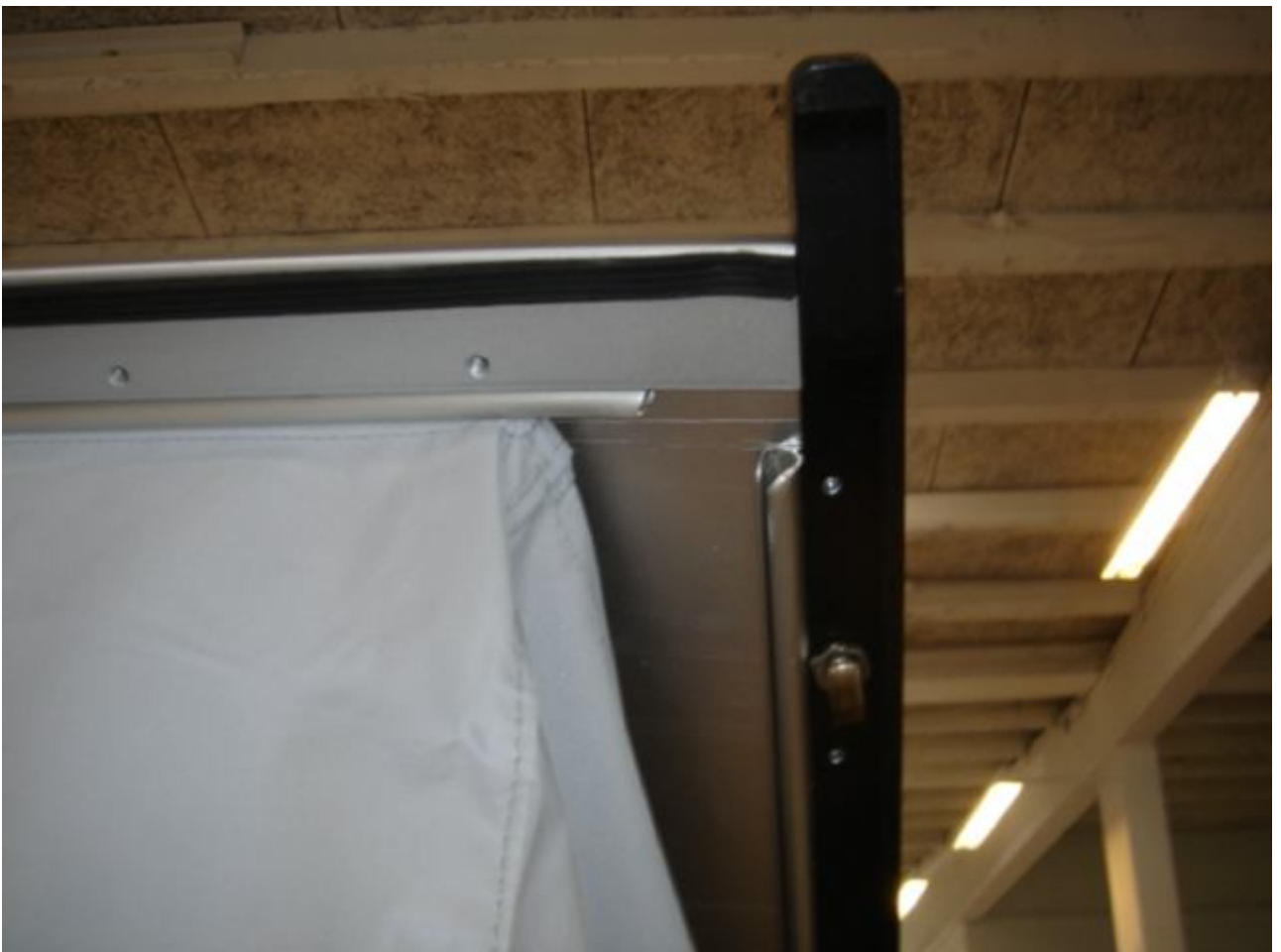
6. Billede af teltdugen og taget.