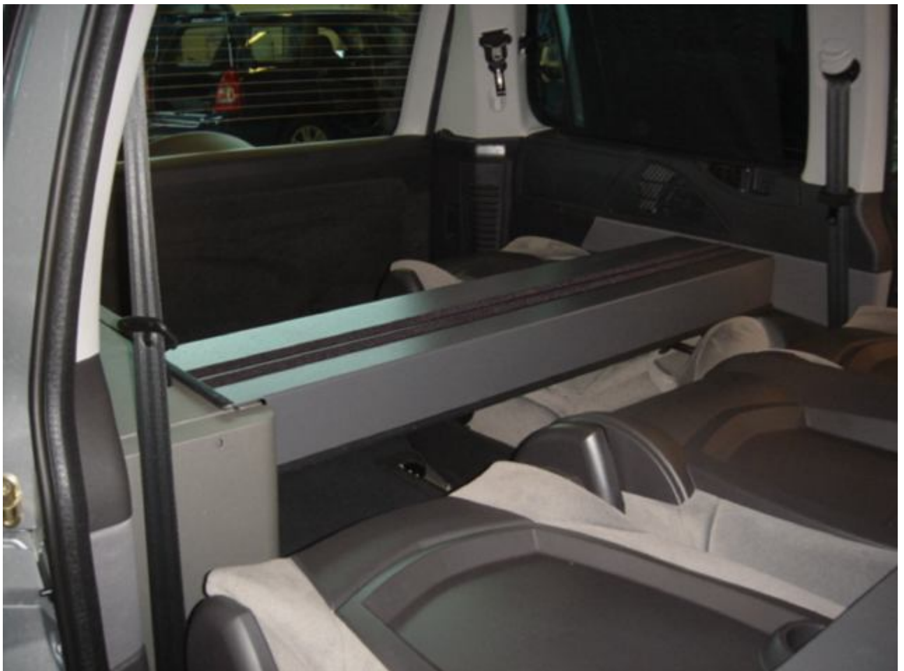
10. Læg ryggen på det bagerste sæde ned og træk nakkestøtten en smule ud. Læg det andet profil ud så det hviler på nakkestøtten og køkkenet. (profilet med velcro på).