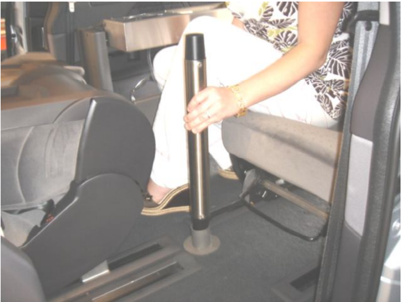
17. Sæt stangen i bundbeslaget. Bundbeslaget kan efter eget ønske afmonteres.