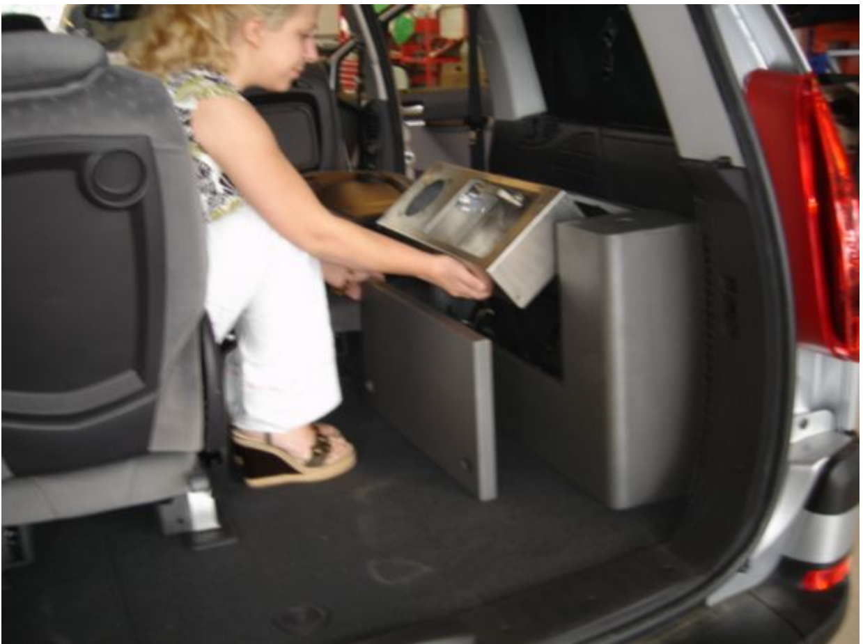
11. Træk køkkenvasken op til vandret, så den går i hak og låser.