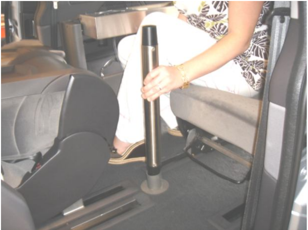
14. Sæt stangen i bundbeslaget. Bundbeslaget kan efter eget ønske afmonteres.