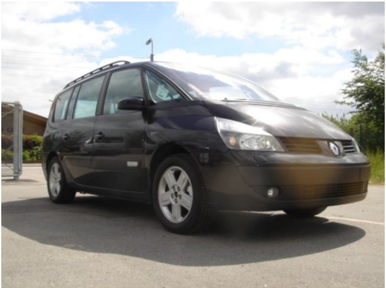
Renault Espace Camper