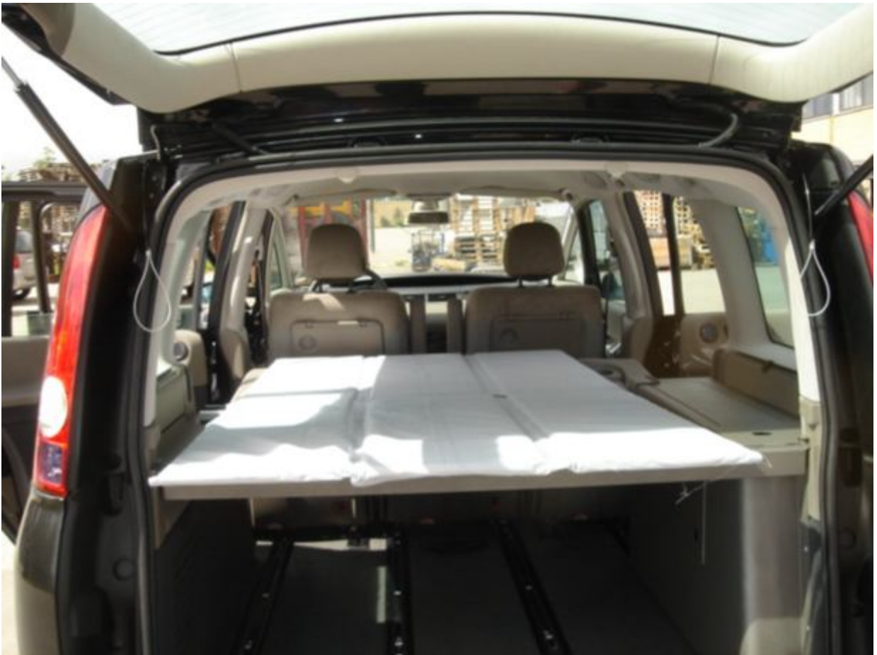
9. Billede af de to nederste sovepladser.