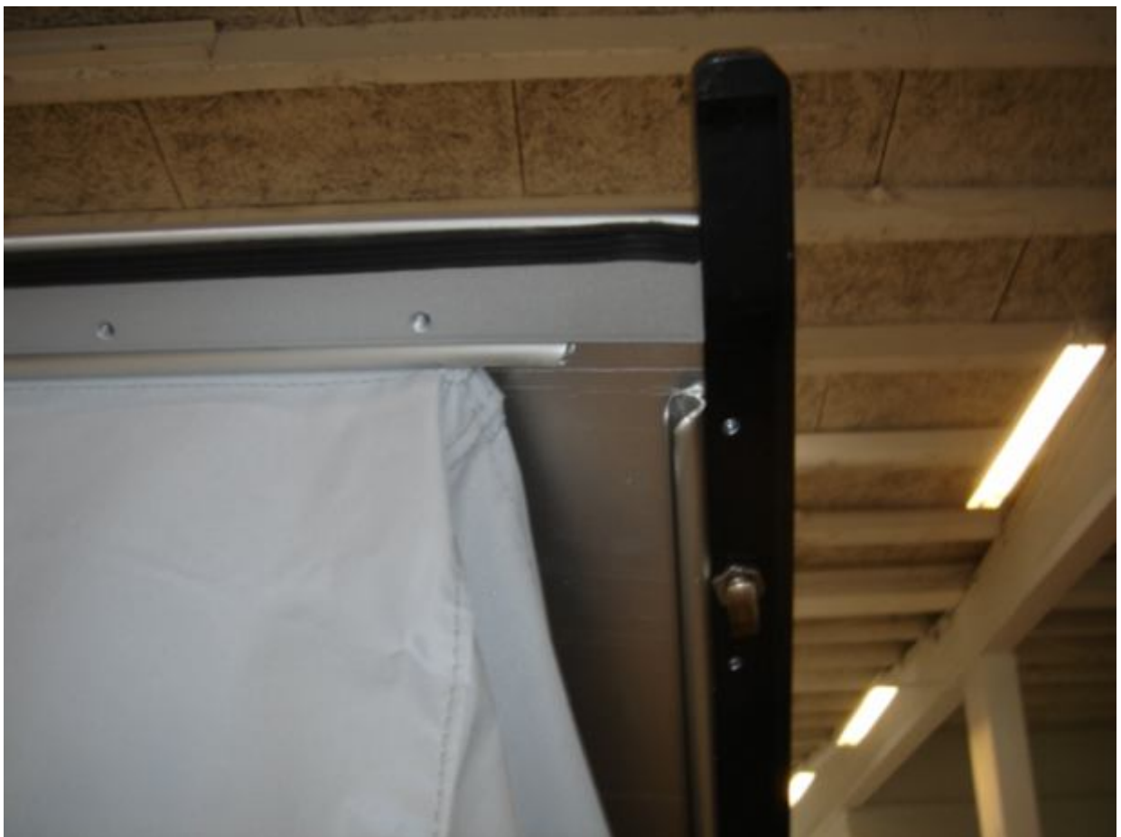
6. Billede af teltdugen og taget.