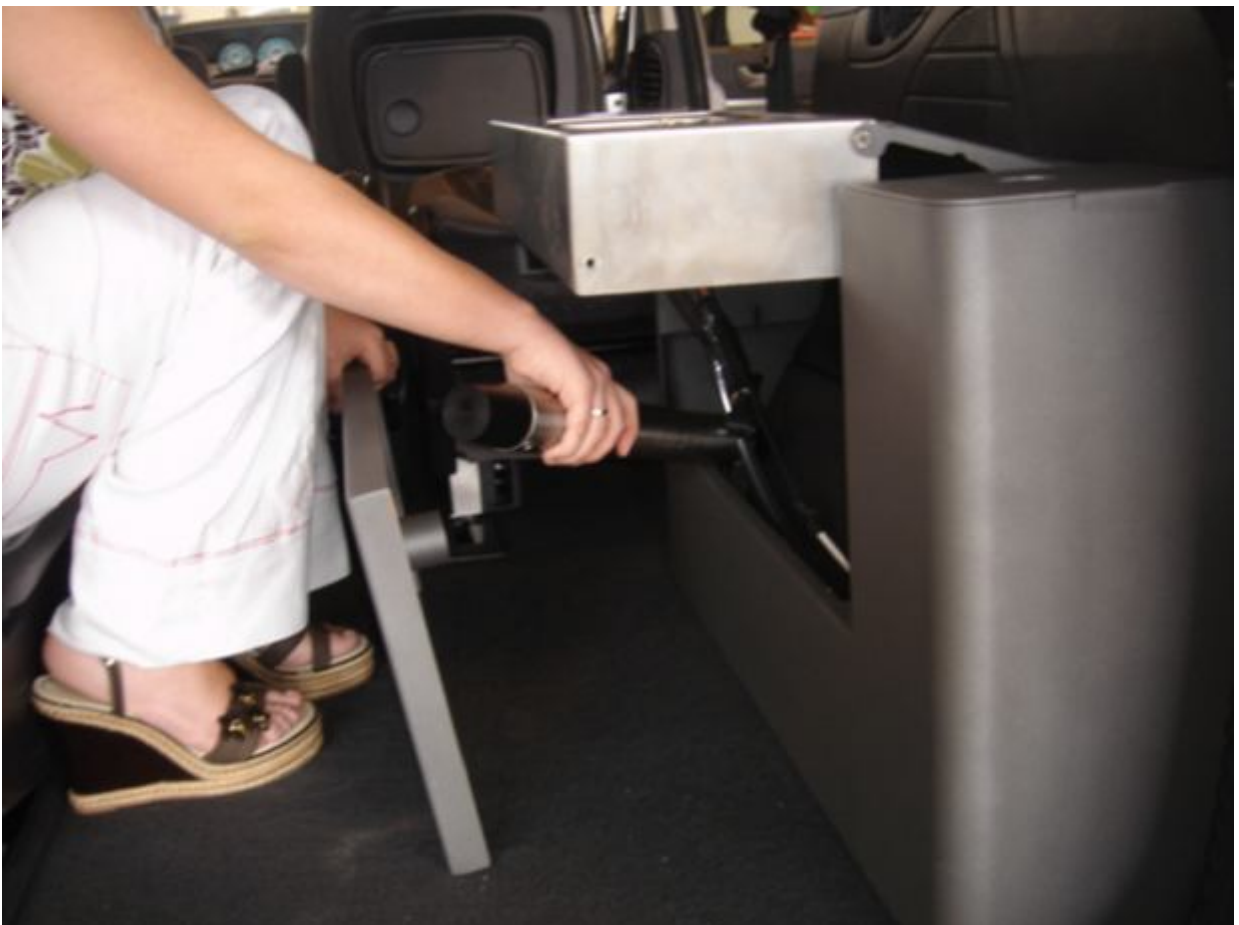
13. I bunden af køkkenet ligger stangen til bordet.